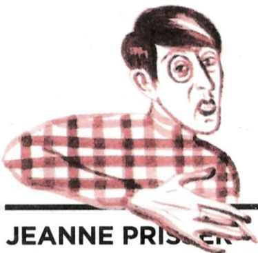
Illustratie vrij naar Otto Dix' Portret van journalist Sylvia von Harden, 1926